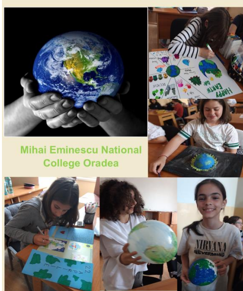
Mihai Eminescu National College Oradea