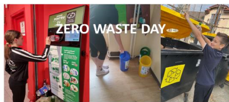
Mihai Eminescu National College Oradea